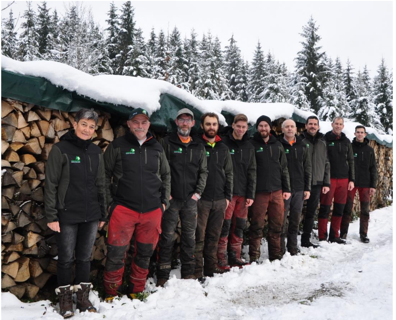
Das FBRZ-Team vor gelagertem Brennholz, einem sehr gefragten Gut im Jahr 2022